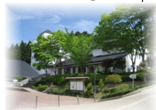
西宮市立山東自然の家

← は自然の家からヒメハナ公園までのウォークラリーのコースです。(徒歩約1時間) ← は自然の家から道の駅までのルートです。(車で約8分)