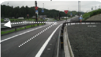
北近畿豊岡自動車道山東IC下り出口付近 春日方面からはこの交差点を左折後、もう一度左折(Uターンする感じ)直進は和田山方面の乗り口です。