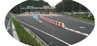
料金所付近 春日方面よりお財布の準備を！ 還坂トンネル

西宮市立山東自然の家までのルート案内 北近畿豊岡自動車道路を利用した場合。 ＜行き＞ ○春日方面から 山東ICを出てすぐ2回左折、約150m先交差点右折。農免道路を直進約1.6km ○和田山方面から 山東ICを出て一般道に合流、約200m先右折し国道427号線を春日方面へ直進、約200m直進後右折。農免道路を直進約1.8km ＜帰り＞ ○春日方面へ 春日方面は国道からのみ進入可能。農免道路から左折し国道427号線を200m直進、左折し山東ICから ○和田山方面へ 農免道路高架橋手前交差点を左折、直進100m、右折後すぐ左折(国道からも進入可能)