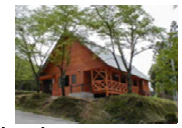
山東アウトドアビレッジ